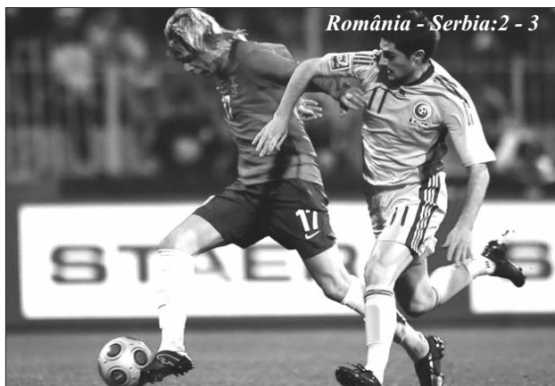
România - Serbia: 2 - 3

Scriam în numărul trecut - de fapt mai mult speram - că drumul spre Campionatul Mondial din Africa de Sud trece prin Constanța și Klagenfurt, dar după două înfrângeri consecutive, e clar că ai noștri vor vedea un alt turneu final la televizor, din sufragerie. E limpede că echipa națională de fotbal a ajuns la un punct de răscruce: calificarea la CM din Africa de Sud e compromisă. Jocul nostru e demn de „cascadorii râsului” iar Pițu, devenit inamicul public numărul unu la ora actuală, se agață cu nesimțire de clauza de despăgubire din contract (600 mii de euro în cazul în care e demis) și declară că nu s-a întâmplat nimic, decât că am pierdut un joc și că mai avem șanse, chiar dacă aproape nule.