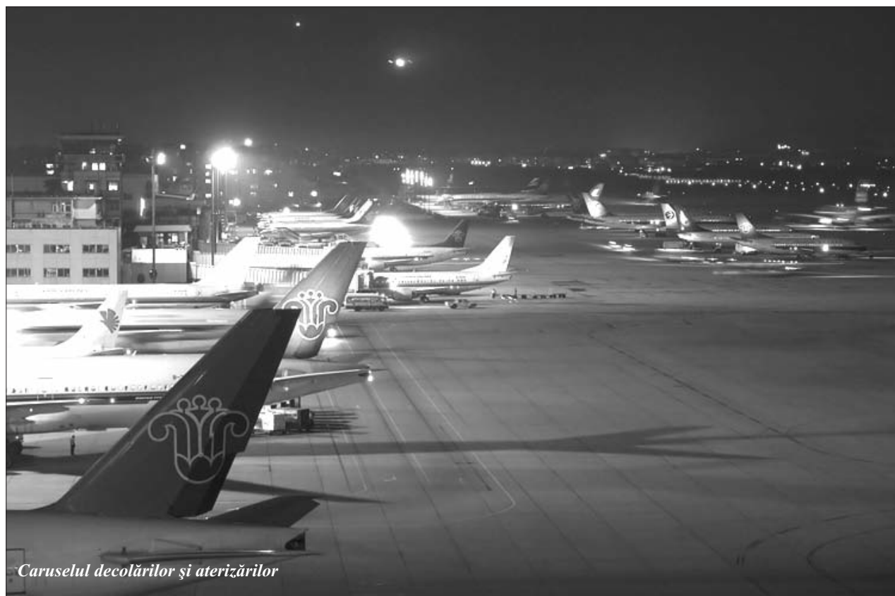
Caruselul decolărilor și aterizărilor