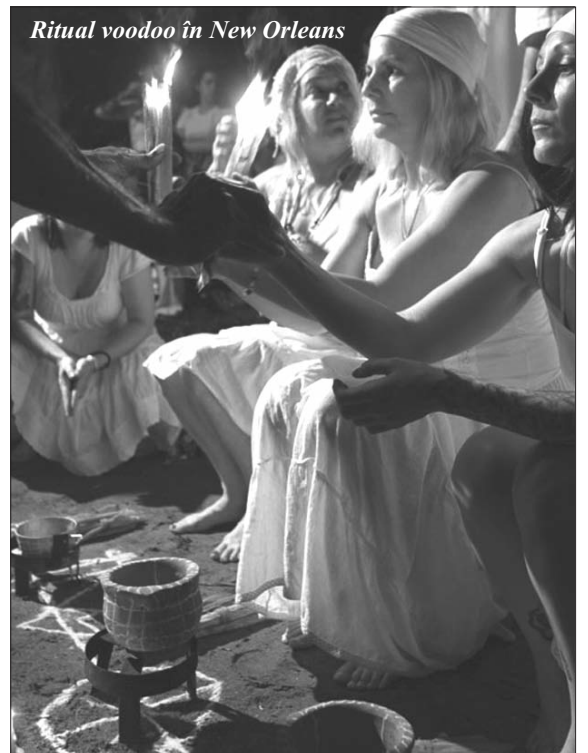
Ritual voodoo în New Orleans

fac afirmații hilare de genul „succes în afaceri garantat”, „întoarcerea ființei iubite în maximum 30 de zile”, nu pot stârni decât zâmbete, făcându-ne totodată să realizăm modul simplist în care este perceput omul occidental din afara sistemului lui. Să fie această complexitate cauza decăderii lui? Viitorul va confirma sau nu. Cert este că de multe ori disperarea sau neputința în fața complexității destinului ne fac să abdicăm de la rațiune și de la analiza cauză-efect, îndreptându-ne speranțele către mister și supranatural, abdicând cu alte cuvinte de la condiția de om în control al destinului său.