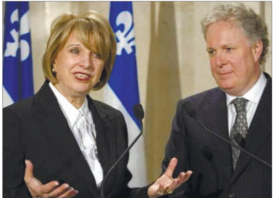
„Acum pleci tu, pe urmă cine știe, ne vine și nouă rândul” pare a spune Jean Charest cu gândul la următoarele alegeri

Întrebată care ar fi realizările ei cele mai importante de-a lungul unei cariere politice de 10 ani, d-na Forget a identificat trei aspecte majore: reglementarea echității salariale, adoptarea unui program de refacere a infrastructurilor care, indiferent de partidul aflat la guvernare, va continua timp de 15 ani și controlul cheltuielilor publice, care a dus la o creștere a cotei de credit a Quebecului. Cu lacrimi în ochi, cea care a fost ținta atacurilor opoziției în ultima vreme, părăsește scena publică cu inima împăcată: „Niciodată nu e un moment prea bun să te retragi din