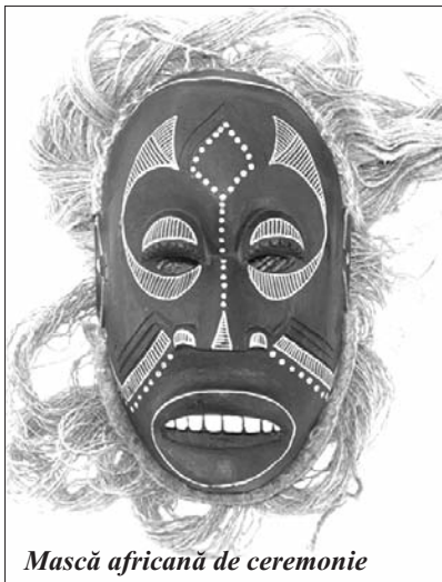
Mască africană de ceremonie

Plantele și incantațiile sunt parte din ritualul prin care șamanul încearcă să vindece diverse boli. Metoda de vindecare se îndreaptă către cauzele bolii, ale dizarmoniei, identificându-le și apoi încercând să le schimbe. Acțiunea fiind probabilistică, succesul nu este garantat. Teoria care stă la baza acestor metode de vindecare e că orice alterare a sănătății omului e cauzată de perturbări comportamentale, perceptuale sau de raport cu mediul.