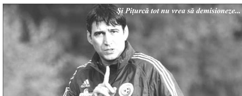
Și Pițurcă tot nu vrea să demisioneze...

pionatul Mondial din 1982 care s-a ținut în Spania. Ceea ce s-a întâmplat atunci este că a fost numit un nou antrenor, în persoana lui Mircea Lucescu, care era pe atunci la Cor-