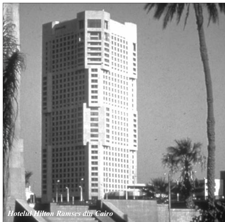
Hotelul Hilton Ramses din Cairo

Echipajele libere, cele care nu aveau de executat curse, se pregăteau deja pentru petrecere. Se știa că la hotelul Hilton Egypt Air organizase un bufet asortat pentru echipajele de străini - bulgari, polonezi și români - și că era prevăzut un spectacol care cuprindea și dansuri specifice arăbești.