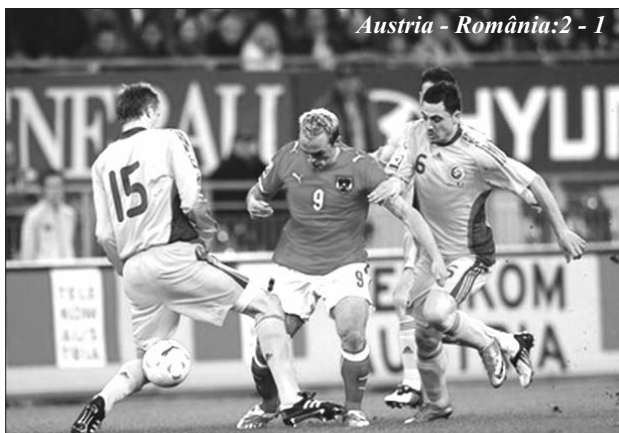
Austria - România: 2 - 1

iar cei din diaspora sunt și ei foarte mândri de eroii lor de pe teren. Când însă rezultatele sunt catastrofale, cum se întâmplă acum, românii sunt tot pățimași și nu stau cu mâinile în sân, schimbând canalul. Deși cei care l-au numit antrenor sunt ei înșiși niște personaje dubioase, la conducerea unui for dubios, FRF, sperăm că vor avea o brumă de respect pentru noi și nu vor ezita să aducă schimbarea - de antrenor, de atmosferă, de mentalitate. Să le amintim Nașului și lui Lucescu că în octombrie 1981 România pierdea cu 2-1 la București contra Elveției, ratând astfel calificarea la Cam-