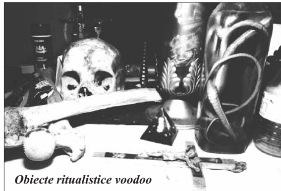
Obiecte ritualistice voodoo

Importat din Africa odată cu aducerea sclavilor pe plantațiile din America centrală, animismul african este modificat de contactul cu creștinismul romano-catolic. Credința într-un Dumnezeu suprem se păstrează în voodoo, dar cum acesta este de neatins, spirite mai „mici” populează întreg spectrul de ritualuri și practici. Influența creștinismului se vede în faptul că divinitatea supremă este asociată dumnezeului iudeo-creștin, el fiind creatorul, iar spiritele sunt asociate sfinților. Practicanții voodoo cred că pot comunica cu aceste spirite prin intermediul viselor, al tranșelor și al procesiunilor rituale. Numeroase practici creștine au fost însă integrate religiei voodoo, ca de exemplu includerea unor rugăciuni catolice.