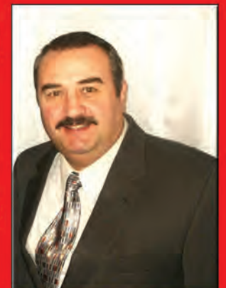
Agent Immobilier Agréé / Chartered Real Estate Agent