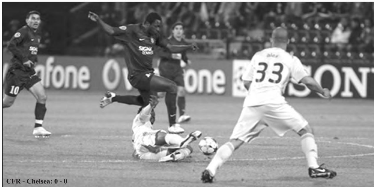
CFR - Chelsea: 0 - 0

echipe ale noastre au fost eliminate. Noroc că din 2009 Michel Platini schimbă sistemul de acumulare al punctelor pe țară și deci rezultatele din acest an nu se con-