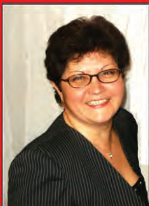
Courtier Immobilier Agréé / B.A.A Sciences comptables